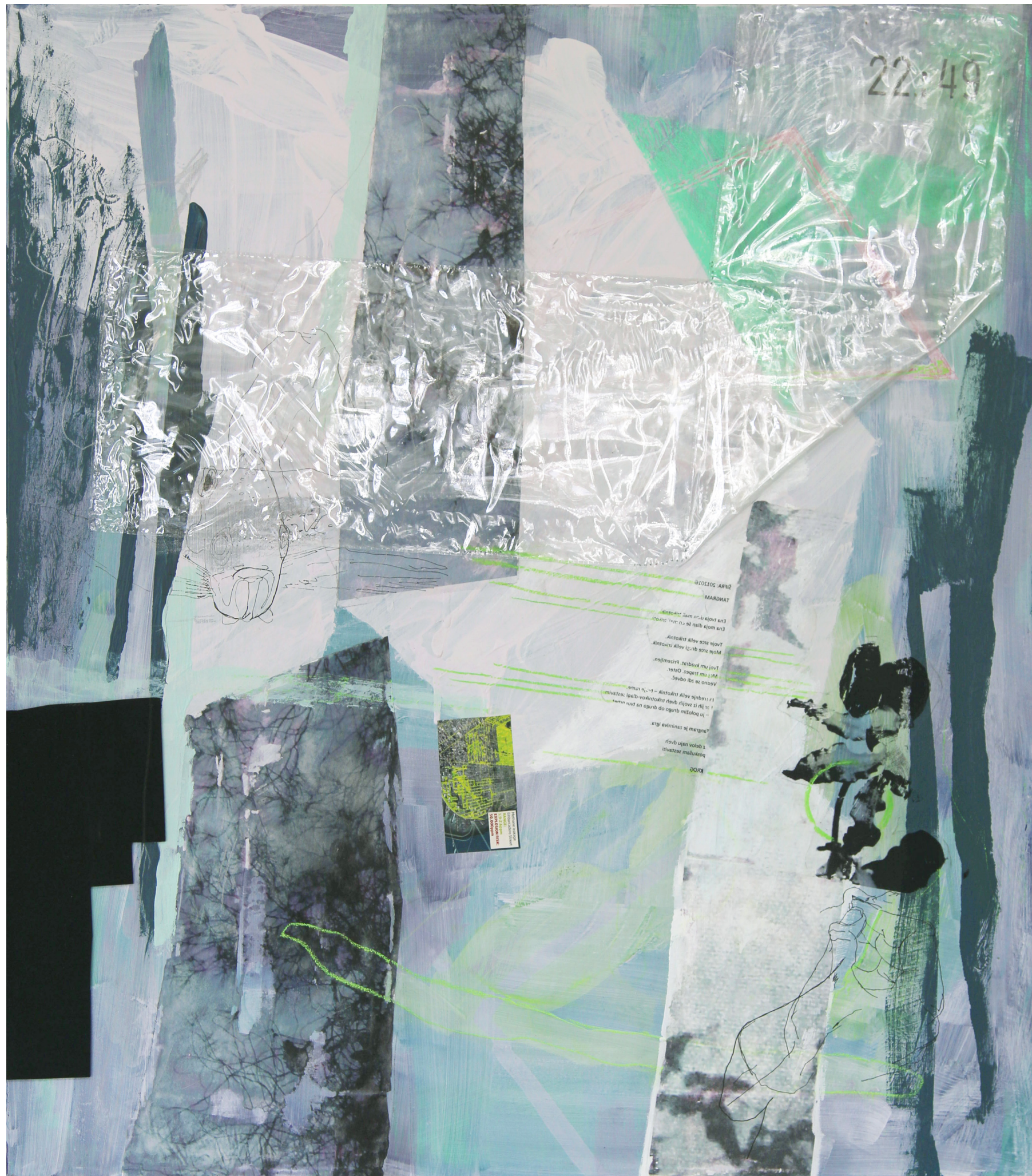
22:49 , 2018, mešana tehnika na platnu, 80x70 cm